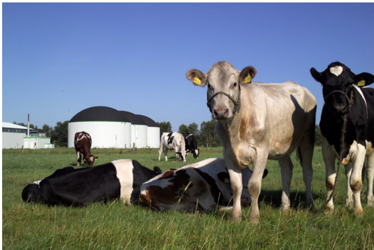
Abb. 4: Biogasanlage Euco Titan 500, Schmack Biogas AG