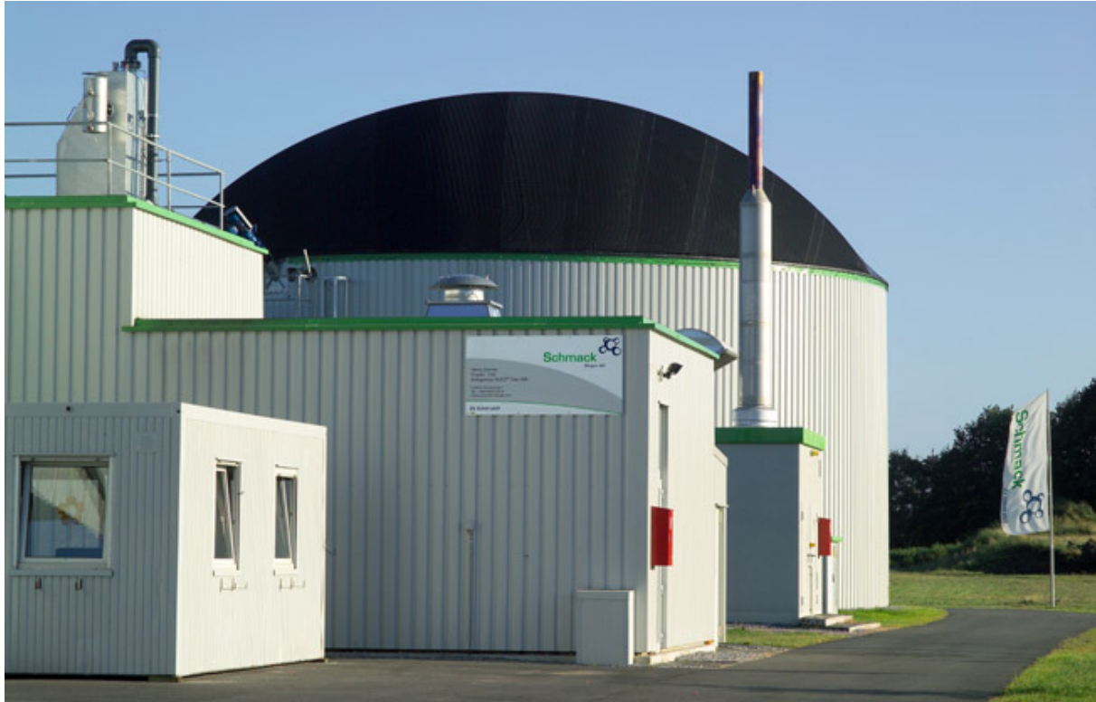
Abb. 2: Biogasanlage Euco Titan 500, Schmack Biogas AG

Biogasanlagen vermeiden Treibhausgase auf zweierlei Weise